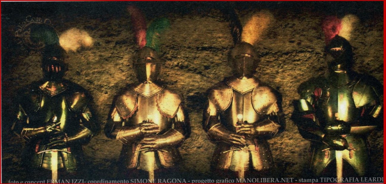
foto e concept ERMAN IZZI - coordinamento SIMONE RAGONA - progetto grafico MANOLIBERA.NET - stampa TIPOGRAFIA LEARDI