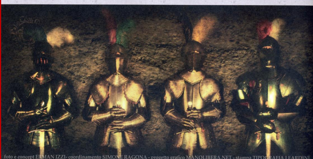
foto e concepti ERMAN IZZI- coordinamento SIMONE RAGONA - progetto grafico MANOLIBERA.NET - stampa TIPOGRAFIA LEARDINI