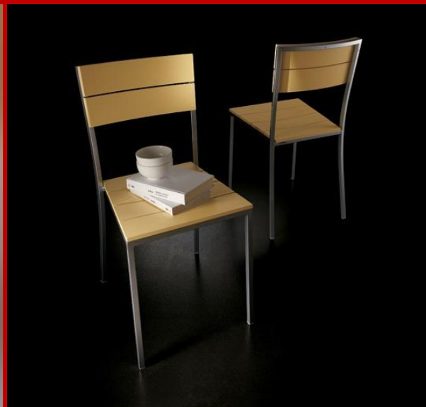
Alcune immagini di prodotti della nostra zona