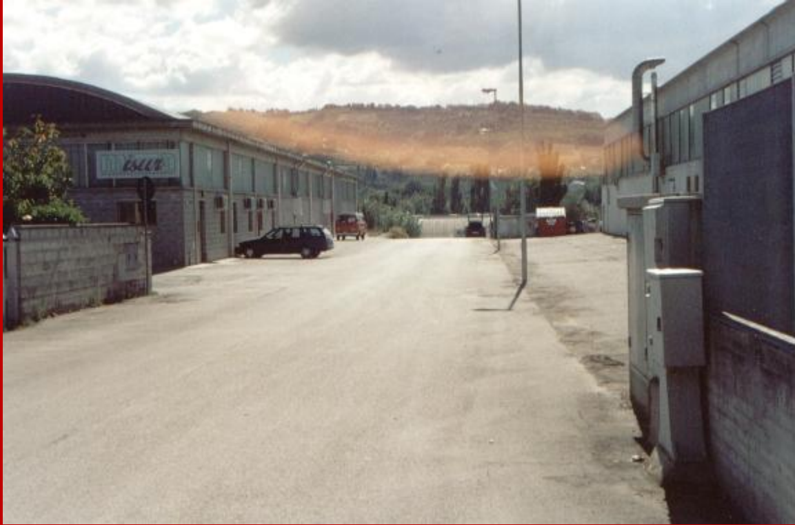
2005 Via Artigianato