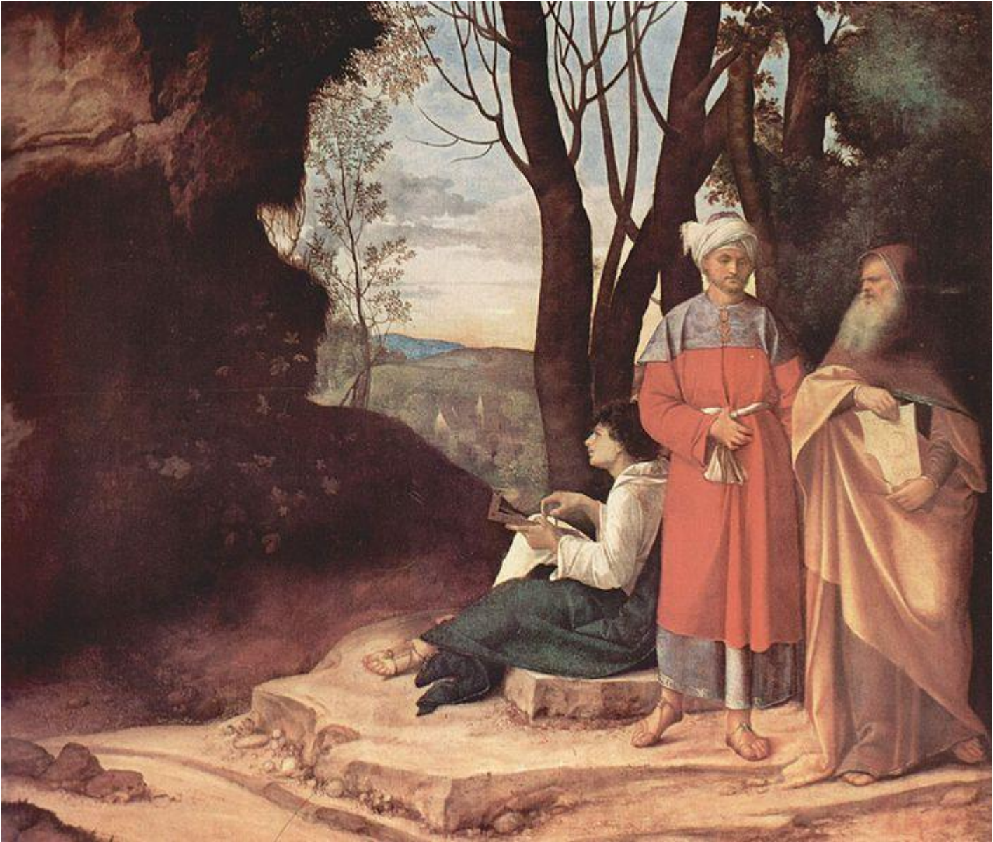
Giorgione, 1505, Kunsthistorisches Museum, Vienna

Da molti definito un pittore "alchemico", Giorgione (1478-1510) rappresenta soggetti fantastici dalle mille sfumature simboliche. Misteriosa e ricca di significati nascosti, l'opera è costruita per colori e masse, senza linee. A sinistra c'è l'imboccatura di una caverna, oscura, verso cui guarda il più giovane, e al centro si apre un paesaggio immerso nella luce che evoca l'avvento in terra del Divino.