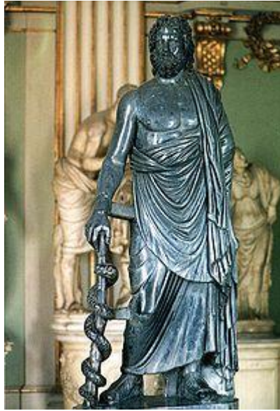
Statua ai Musei Capitolini di Roma

Dio della salute e della medicina, Asclepio era figlio di Apollo e della ninfa Coronide. Affidato al centauro Chirone affinché lo educasse, Asclepio studiò l'arte medica dei "semplici" - come sono chiamate le erbe con potere medicinale - e divenne esperto anche nella chirurgia, inventando rimedi meravigliosi per ogni male. Si diceva che sapesse anche far rivivere i morti, tanto che gli venne attribuito il merito della risurrezione di Ippolito, ma proprio per questo suo temerario gesto di sfida verso le leggi della vita e della morte, venne fulminato da Giove.