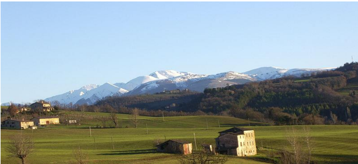
Le campagne intorno a Camerino

A me che è sempre piaciuta la campagna, partire dal grigio traffico assordante di Roma per andare a Camerino era e sarà sempre un piacere. Ricordo l'aria fresca e profumata dell'appennino già a metà strada. La nostra casa è fatta di mattoni come non se ne fanno quasi più, con quell'odore inconfondibile di pietra, di campagna. Non ho mai amato il moderno, e tornare nella casa di Palentuccio è come tornare indietro nel tempo. Ambiente spartano e contadino, dove spesso mi trovavo ai piedi scarponi enormi sempre infangati. L'odore della legna che brucia mi dà quel senso di semplicità che in città manca. Ricordo la cantina del pecoraro del paese, sembrava di entrare in una grande botte di vino aromatizzato dalle caciotte tenute sospese su tavole di legno a maturare. Ricordo i pavimenti, mai lisci, fatti di grandi pietroni color argilla, che sembravano sempre impolverati, ed il portone, di legno verniciato di verde geranio, con la classica chiave antica che mi ricordava sempre quella che apriva lo scrigno del forziere dei pirati. Ricordo sempre di tornare in quei posti dove ogni volta scopro l'ennesimo motivo che mi spingerà prima o poi a godere del silenzio della campagna, l'odore dell'erba appena tagliata ed i colori delle colline marchigiane, davanti alle quali mi incantavo ore ed ore ammirandole dall'alto della Rocca di Camerino.