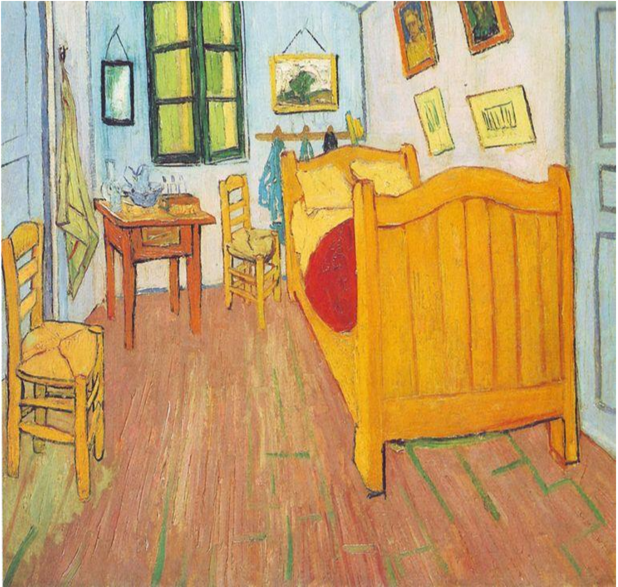
La camera di van Gogh, olio su tela, 1888, Van Gogh Museum, Amsterdam