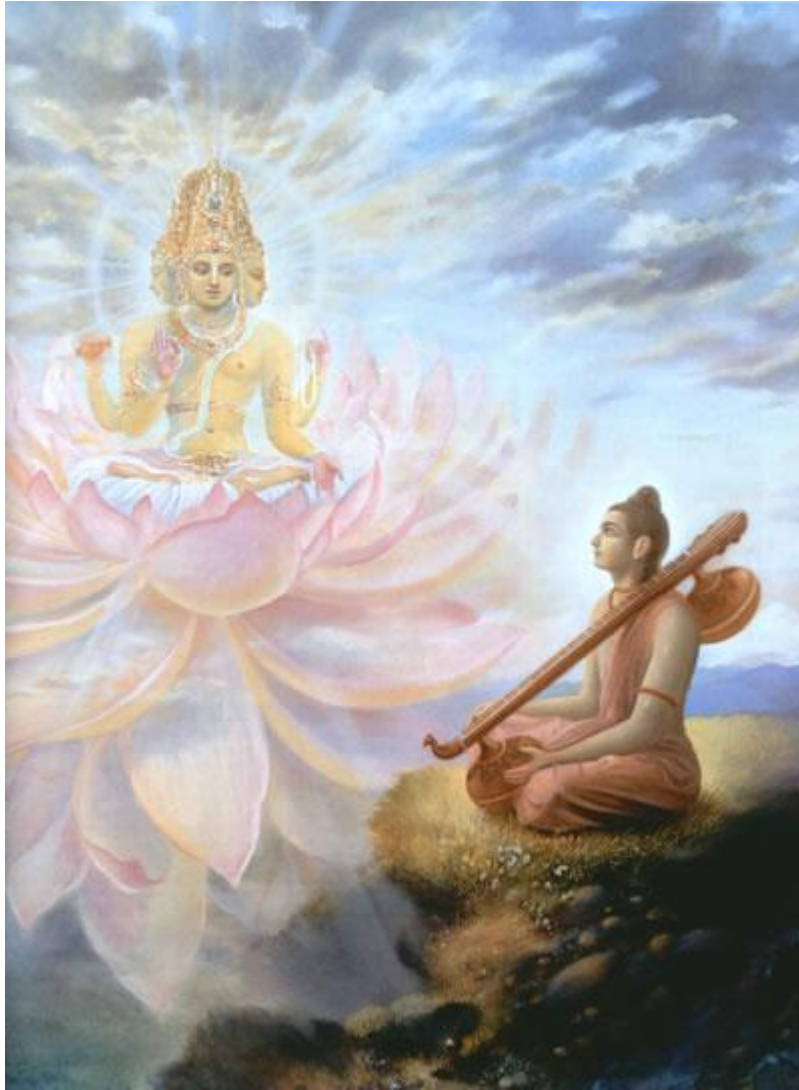
Brahma, il primo maestro spirituale dell'universo, trasmette gli insegnamenti di Sri Krishna a Narada Muni, suo figlio e discepolo.