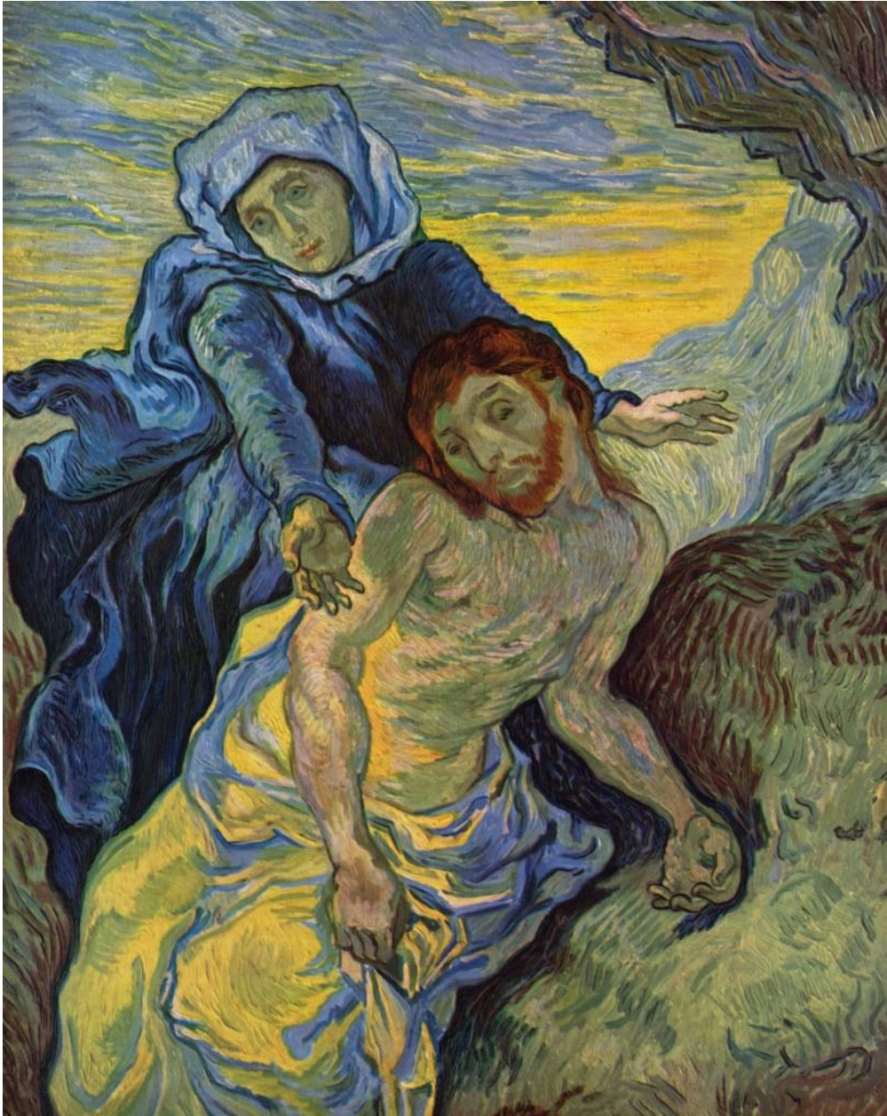
La Pietà dopo Delacroix, Vincent van Gogh, 1889