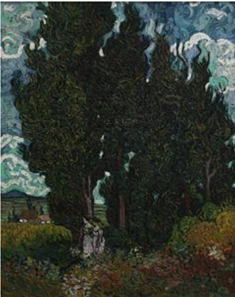
Cipressi , olio su tela, 92x73 cm, 1889, Van Gogh, Kröller-Müller M. Otterlo

consulenze psicoterapie individuali sostegno psicologico corsi di arteterapia tecniche di rilassamento