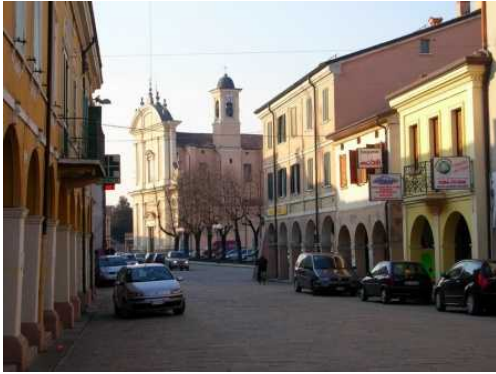
Il centro storico di Poggio Rusco prima del sisma