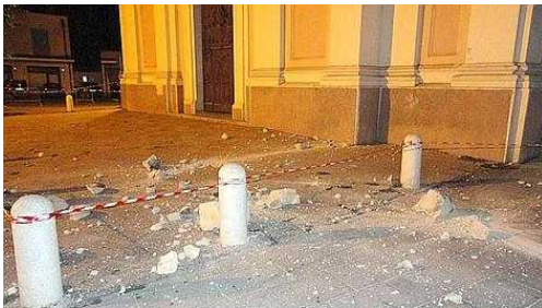
Calcinacci dal campanile, dopo la prima scossa