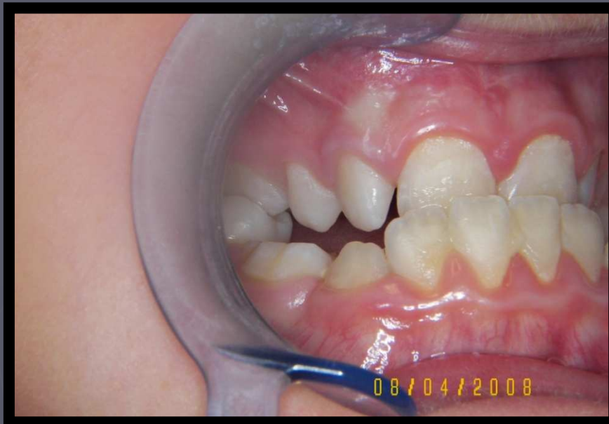
Iniziali aprile 08