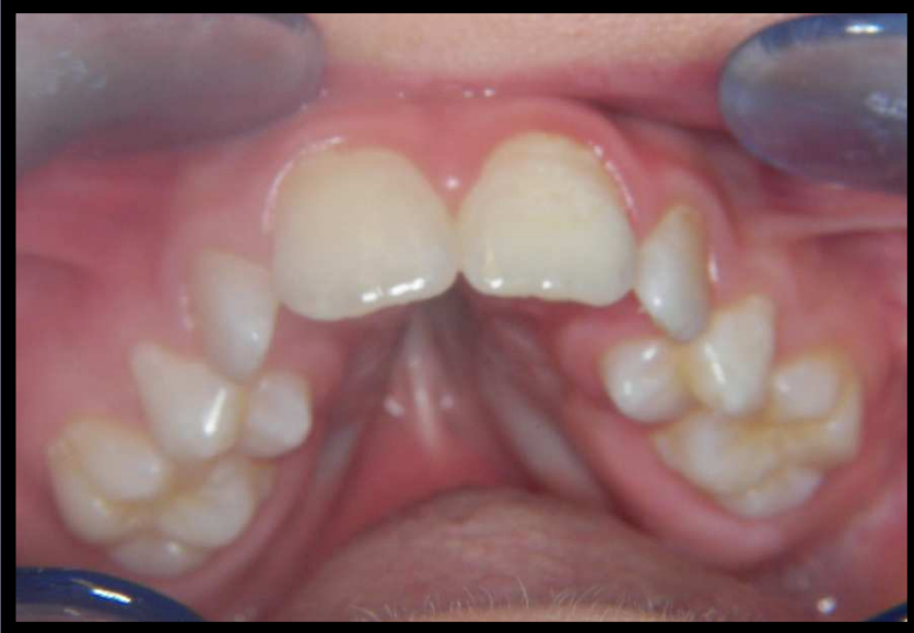
Iniziali aprile 08