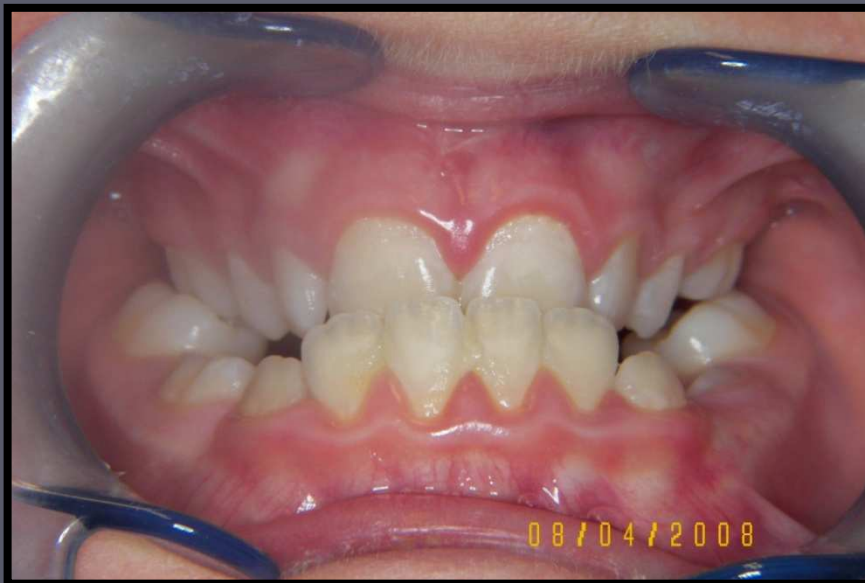
Iniziali aprile 08