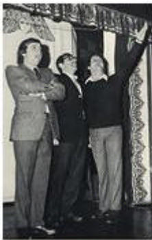
Cochi Ponzoni e Renato Pozzetto

Negli anni settanta, grazie anche alla televisione, si ebbe una diffusione ancora maggiore del cabaret con innumerevoli esempi da ricordare con simpatia ed anche con una punta di commozione, pensando al grande Massimo Troisi de " La Smorfia " con Decaro e Arena a Napoli. Ancora a Milano, che definirei capitale del cabaret senza togliere merito alcuno ad altre città, dove cominciarono ad apparire Cochi e Renato, Boldi, Teocoli, e tanti altri, per non parlare della partecipazione a questo tipo di spettacolo di attori del calibro di Paolo Villaggio e Dario Fo, di Benigni, e Gigi Proietti a Roma.