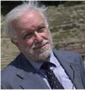
Luciano De Crescenzo

mille gusti diversi, svariate metodologie di parcheggio e qualche punto di vista comune.