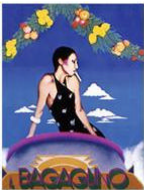
Locandina del Bagaglino