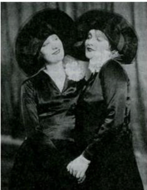
Marlene Dietrich e Margot Lion

In un noto locale berlinese, l'Eldorado, era consentito ai gay e alle lesbiche di frequentarsi, soprattutto alle donne. Nel 1928, quando si contavano già oltre 45.000 soci di diverse organizzazioni omosessuali tedesche ed esisteva addirittura una rivista lesbica, "Die Freundin", Margot Lion e nientemeno che la famosa Marlene Dietrich cantavano Wenn die Beste Freundin (...quando la migliore amica) con indosso delle violette.