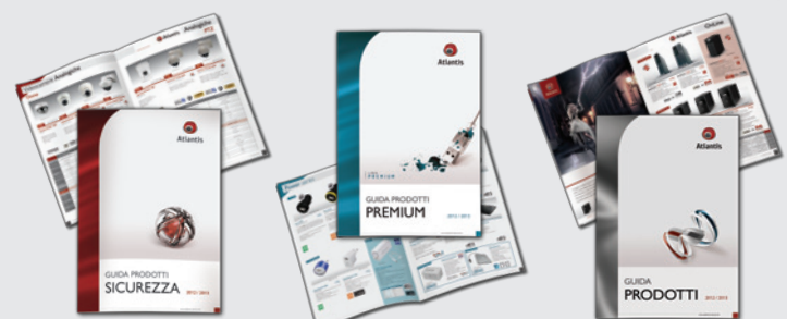
Catalogo Prodotti Sicurezza (fto A4)