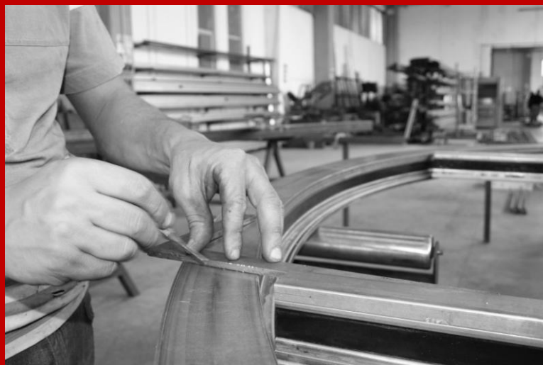
Lavorazione infissi in acciaio