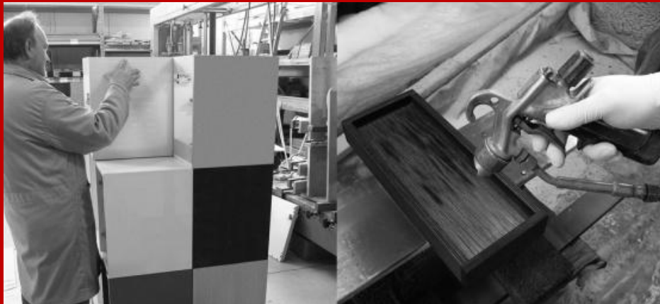
Verniciatura di un prodotto

Per maggiori approfondimenti vai su Wikipedia l'Enciclopedia libera