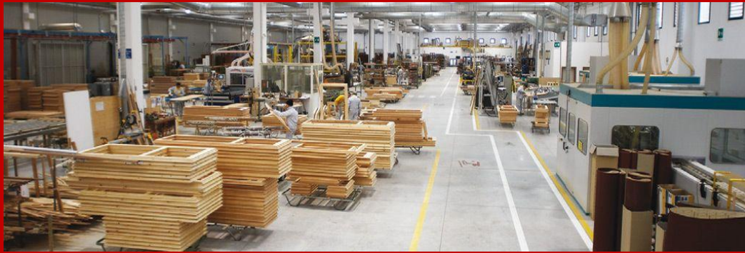
Produzione finestre in legno