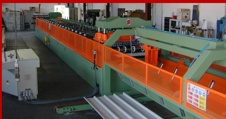
Produzione lamiera ondulata