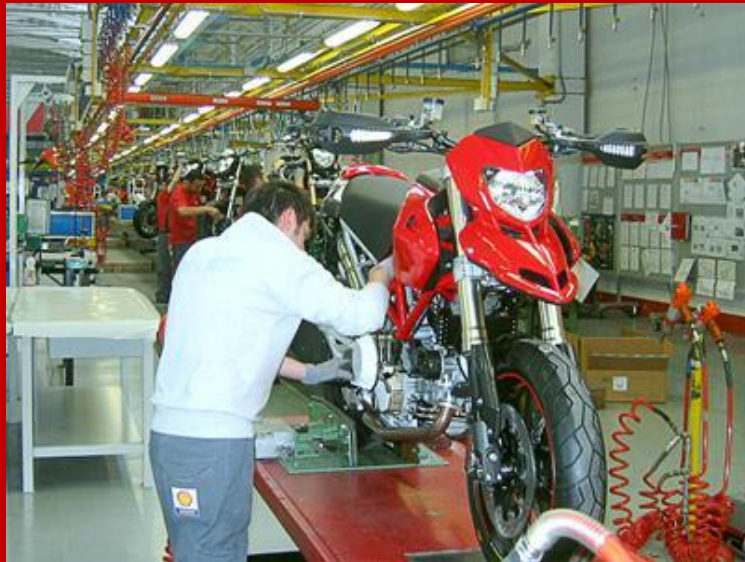
Produzione moto Ducati