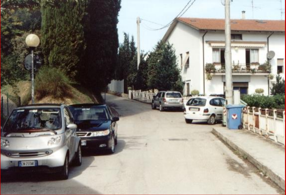
2005 Viale dei cipressi