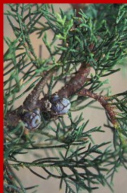
Foglie e strobili di Cupressus arizonica

Alcune specie di cipressi hanno avuto successo a scopo ornamentale e sono state piantate nelle regioni a clima caldo o temperato di quasi tutto il mondo.