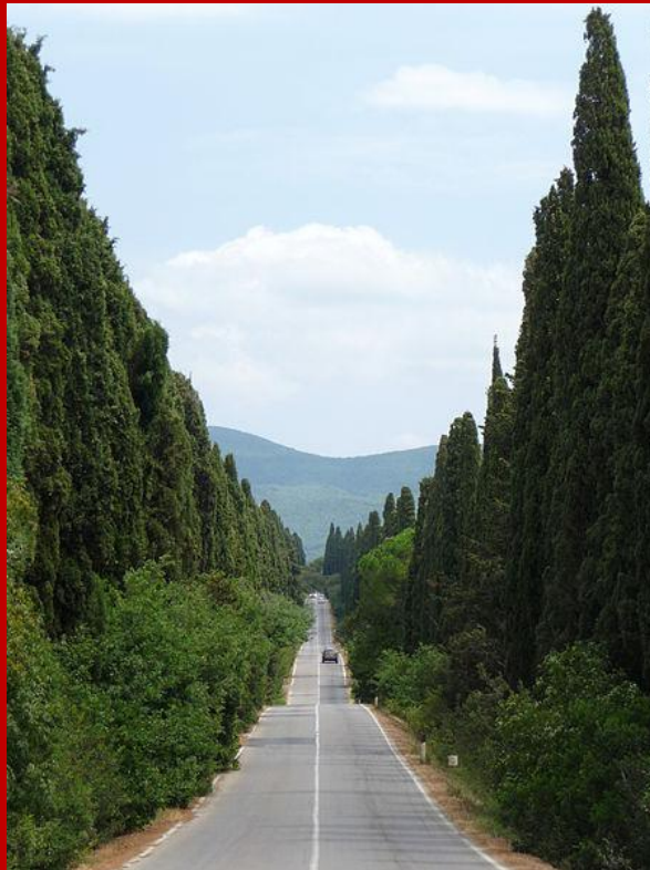
Il Viale dei Cipressi tra Bolgheri e l'oratorio di San Guido in Maremma