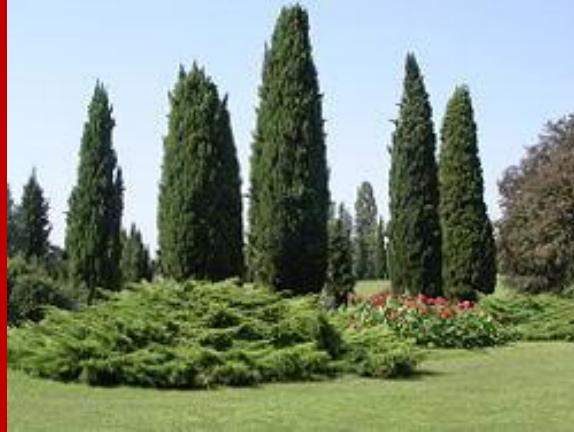
Cipressi all'interno di un parco

È l'albero tipico dei cimiteri perché le sue radici, come quelle di tutti gli alberi, hanno estensione e sviluppo corrispondenti a quelli dei rami; quindi, nel caso del cipresso, scendendo a fuso nella terra in profondità invece che svilupparsi in orizzontale (come per le querce e gli altri alberi a chioma larga), non danno luogo a interferenze con le sepolture circostanti.